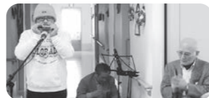
高齢者施設でのボランティア活動の様子