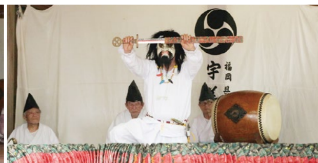
図 シティプロモーション課 文化財保護係 ☎ 934-2370 FAX 934-2371