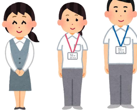
主任ケアマネジャー