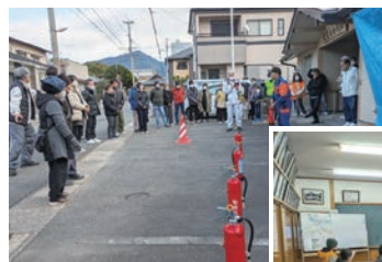
◀消防団による 水消火器訓練

災害時には、自助と共助(互助)が重要であり多くの命を救います。今後も、普段から防災意識を高く持ち、地域でご近所の声掛けや訓練を実施して、災害に強い地域づくりを行っていききたいと思います。