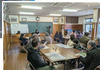
防災士による 防災講話▶