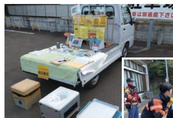
◀防災備蓄品の展示