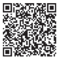
町ホームページはこちら