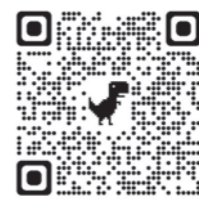
日本年金機構のホームページはこちら