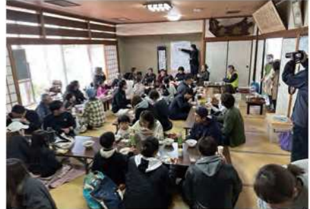
▲終了後皆で昼食をとる様子

イベントには「ライジングゼファーフクオカ」の協力によるバスケットボールの種目を盛り込めたほか、地域の飲食店による出店ブースもあり、イベントが活気づきました。