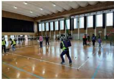
バドミントンの羽を 筒でキャッチ!

このイベントは、共働事業提案制度を活用して桜原小学校区コミュニティ運営協議会が実施したもので、練習不要で誰でも簡単にできる6つの種目をリレー形式で行い得点を競い合うものです。子どもから大人まで幅広い世代の人たちが楽しめる、新しく考えられたスポーツとなっています。