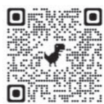
▲法務省ホームページ