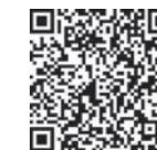
HPVワクチンの キャッチアップ接種について