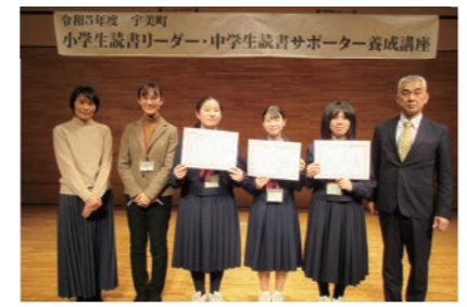
▲新たな読書サポーター誕生!

1月27日(土) 地域交流センターで令和5年度宇美町「小学生読書リーダー・中学生読書サポーター養成講座」、実践報告会・閉講式が行われました。実践報告会では、小学生読書リーダーは各学校で行ったおはなし会や読み聞かせなどの報告、中学生読書サポーターは、ミニビブリオバトル大会の実践を交えて報告し、閉講式にて認定証が授与され、13人の「読書リーダー」、7人の「読書サポーター」が誕生しました。リーダー・サポーターは、継続して、読書の楽しさを伝える活動を行います。