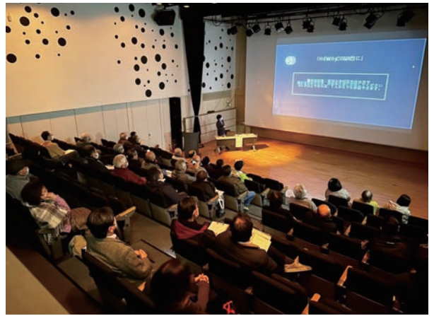
▲多くの参加者が「見やすくなるポイント」を学びました