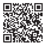
接種券発行申請フォーム