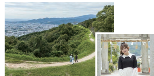
▲大野城跡からみた風景

また、シティ情報ふくおかの11月号・1月号・3月号で、宇美町の特集が掲載されますので、ぜひ、ご覧ください。