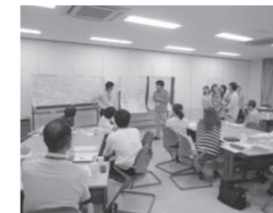
6月23日のワークショップの様子

今後策定する新たな事業計画や計画に基づく事業の推進について意見をいただくため、子どもの保護者や学識経験者、子ども・子育て支援の関係者等17人の委員で構成する「宇美町子ども・子育て会議」を設置し、新制度に向けた議論を進めています。