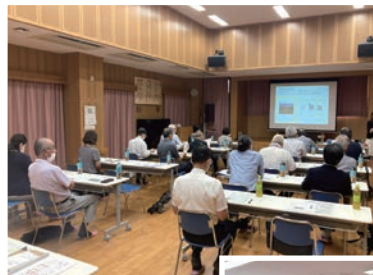
◀活動内容を聞き、たくさんの気付きが得られました。

校区コミュニティや自治会では「楽しく住みやすい地域」となるように、積極的に活動をしています。ぜひ皆さんもお住まいの地域活動に目を向けて、まずはできることから始めてみてください!!