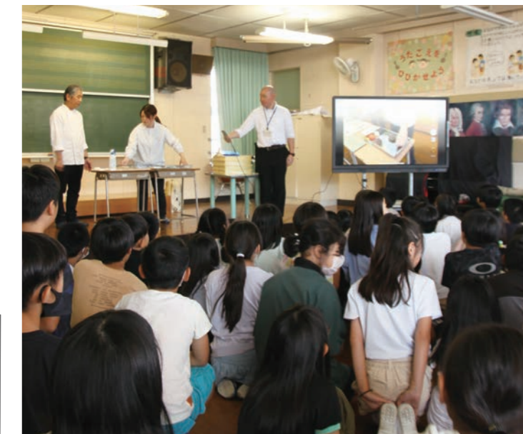
▲和菓子作り実演の様子