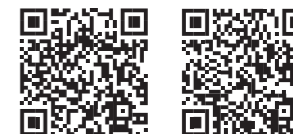
予約はこちら 接種券発行申請フォーム

※成人(12歳以上)の初回接種、乳幼児、小児接種も引き続き行います。 ※すでに接種券がお手元にある人は、そのまま使用できます。(再発送は、行いません) ※秋開始接種期間中のワクチン接種は、1人1回。(初回接種を除く)