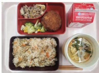
▲給食のメニュー例

中学校給食は全生徒を対象に選択制弁当給食を実施しています。学校給食摂取基準に沿って町の栄養士が作成した献立に基づき、福岡県学校給食会から食材を調達し、調理・盛り付け・配送は民間業者に委託しています。短い給食時間に対応できるようお弁当箱タイプの食器を使用し、温かいものは65℃以上、冷たいものは10℃以下に温度管理されています。