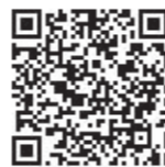
しめ縄リース作り