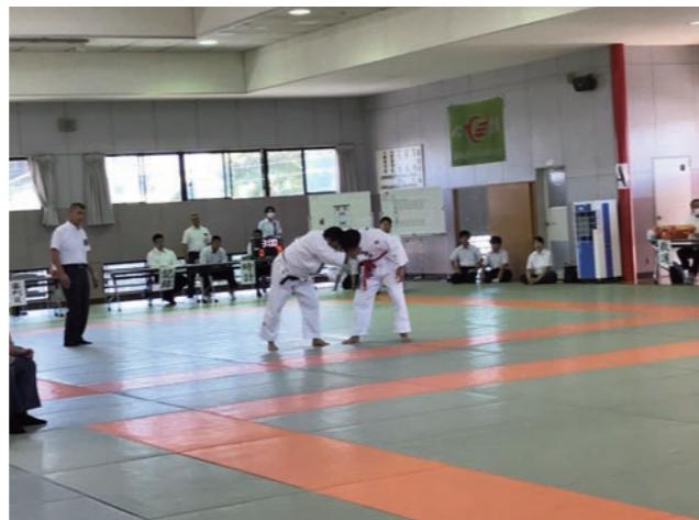
▲柔道試合中の様子