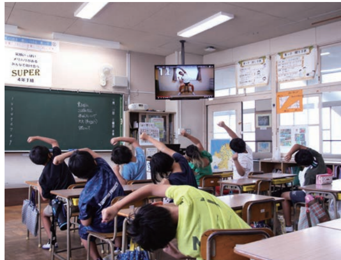
▲東っこタイムの様子