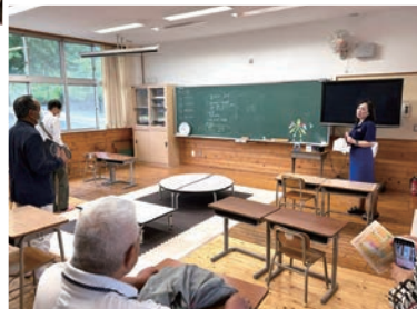
エナジーあふれる宮原事務局長▶