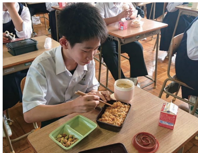
▲給食の時間(宇美東中)