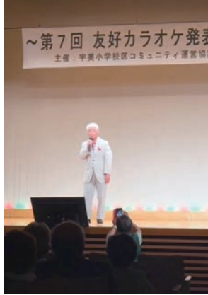
▲自慢の歌声を披露♪