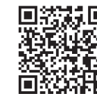
接種券発行申請フォーム