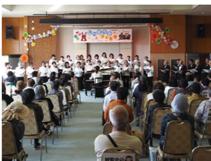
しーずうみフェスタで歌声発表

直接資格を取得する講座は実施していないが、知見を広げるきっかけづくりや、入り口となるような講座を開設している。 (全員賛成で可決)