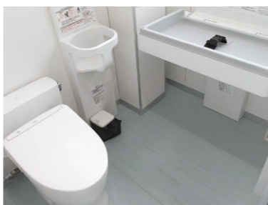
男性用トイレに 乳幼児用おむつ交換台を設置

令和4年度宇美町立中央公民館及び宇美町住民福祉センタートイレ改修工事 既設配管の老朽化による増工等に伴い、工事請負額を5599万円から5819万3300円に変更。 (全員賛成で可決)