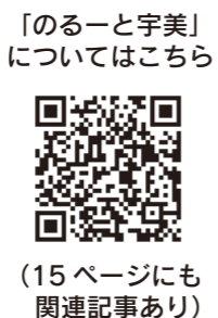
「のーと宇美」 についてはこちら (15ページにも 関連記事あり)

◇オンデマンドバス運行支援業務委託料 148万円増額 「のーと宇美」の予約アプリとLINEを連携させるための経費。