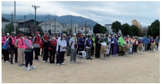
▲校区ごとに整列し、開会式に臨む参加者の皆さん