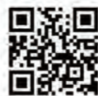
のるーと宇美 専用ページ

申・問 まちづくり課 商工観光係 ☎934-2370 FAX934-2371 ✉knowroute@town.umi.lg.jp