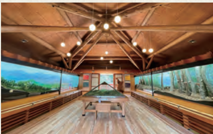
▲ワンヘルスの森ミュージアム (見学など詳細は県民の森管理事務所へ 電話:932-7373)

令和4年11月に、オープンしたこのミュージアムには、宇美町が所蔵する大野城跡出土資料や、四王寺山に関連するパネルを展示しており、この山の歴史や自然環境について学ぶことができます。施設になっています。