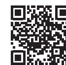
国税庁 確定申告書等作成はこちら

問 香椎税務署(〒813-8681 福岡市東区千早6-2-1) ☎ 661-1031