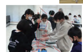
▲ストロータワー 作成の様子