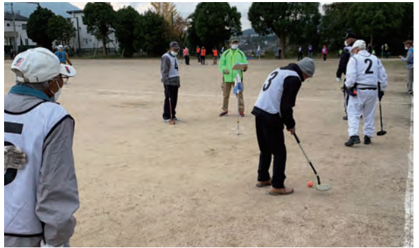
▲狙い澄ました一打!めざせホールインワン!!