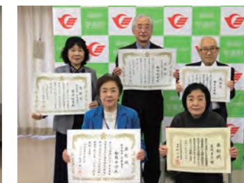
▲表彰を受けられた皆さん