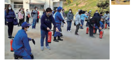
▲消火器訓練の様子