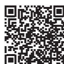
厚生労働省 ホームページ