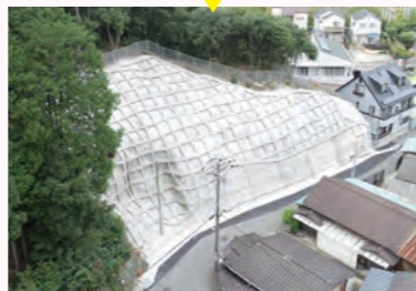
▲原田下のり面補強

土砂災害計画区域にある急傾斜地に対し、法面崩壊を未然に防ぐために、整備しています。