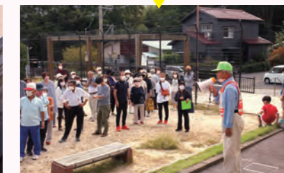
▲宇美小コミュニティ避難訓練

避難するシチュエーションはさまざまですが、やってみないと分からない事が多くあります。実際に動いてみて、危険のポイントを確認していました。