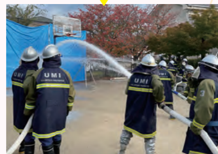
▲火災を想定した防火演習の様子