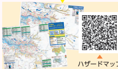
▲防災ハザードマップ

大雨による土砂災害や想定外の大雨が降った場合の河川からの浸水害など、自然災害から身を守るため、国や県が公表した土砂災害・浸水の被害予想図をもとに「宇美町ハザードマップ」を作成しました。