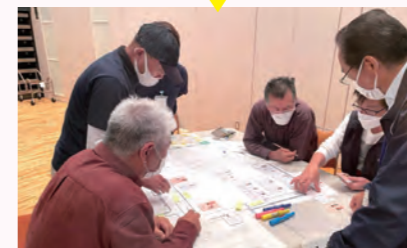
▲桜原小コミュニティ机上訓練

実際に避難所を運営した場合、どういった問題があるか班で話し合いながら進めていました。