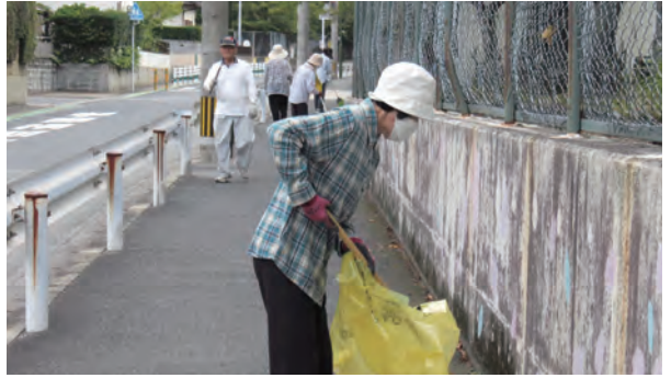
▲通学路もきれいになりました