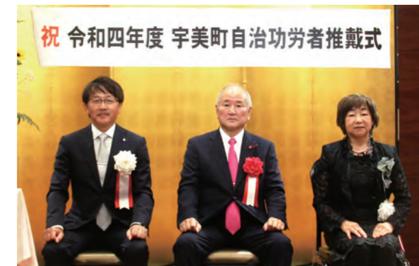
▲(左から)町長、木原前町長、議長

平成26年3月から2期8年間にわたり、宇美町長として「ひとが輝き!地域が輝き!!まちが輝く!!!元気なまちづくり」を基本理念とし、共働による地域づくりの推進や子育て環境の整備、歴史的・文化的資源の活用によるにぎわいの創出に御尽力されました。また、町制施行100周年という大きな節目を迎え、次の100年に向けての町づくりに大きく貢献されました。