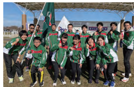
▲町を代表してタスキをつないだ選手たち