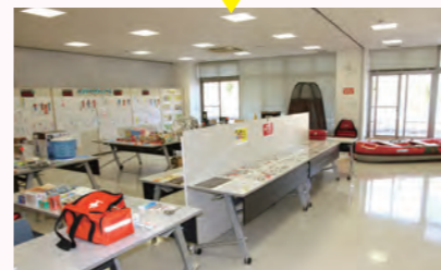
▲原田小コミュニティ防災展示

10月8～9日(土・日)の2日間、災害時の資料や、防災グッズなどを展示しました。災害シミュレーションの映像も上映し、防災・減災への啓発が行われました。