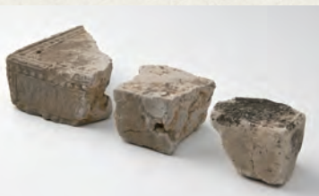
▲大野城跡出土の文様埴 (宇美町立歴史民俗資料館で展示中)

これが発見されているということは、やはり、大野城跡の建物跡は、稲倉だけではなく、役所的機能をもつ建物もあったと推測されるのです。