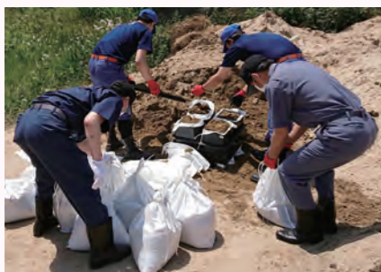
▲水害に備え、土のうを作成している様子

火災の時はもちろん、災害の時も活動している消防団。町内に10の分団あり、現在所属している団員の数は、144人です。有事の際には、集まって活動に当たります。町内での防災啓発活動や、災害や火災を想定した訓練を行い、町民の皆さんの安全と安心を守っています。