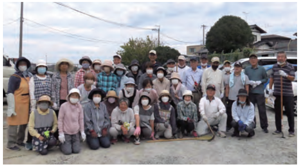
▲会員全員で協力して取り組みました