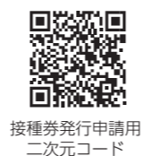
接種券発行申請用 二次元コード

4回目接種を7月から開始し、対象の人には随時接種券を発送しています。高齢者施設従事者、医療従事者などで接種を希望する人は、申請が必要です。ワクチンは、3回目接種と同様で、ファイザー社またはモデルナ社となっています。