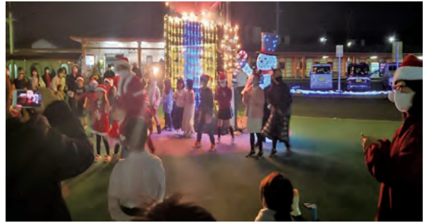
▲宇美駅前でのイベントの様子