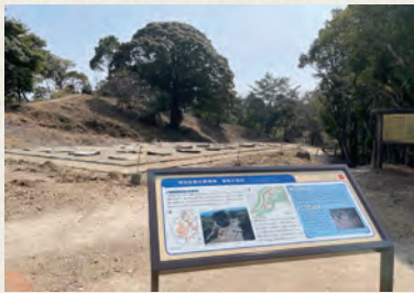
▲新たに設置された解説板と建物跡

最近、増長天地区の建物跡に、解説板が新しく設置されました。発掘調査の最新成果も反映されていますので、ぜひご覧ください。 増長天地区は、尾花地区・焼米ヶ原の駐車場から徒歩約3分のところにあります。