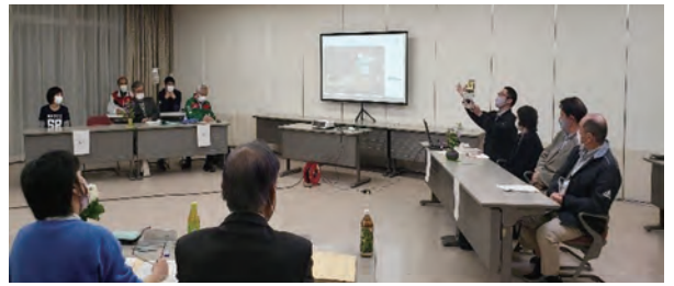
▲プレゼンテーション審査の様子