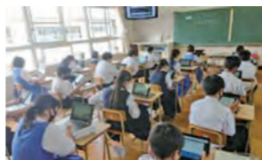
▲学校 ICT 推進事業

豊かな自然と歴史に守られた「ふるさと宇美町」にゆかりのある人や、町のふるさと応援寄附事業に魅力を感じ、個性豊かで活力に満ちたまちづくりとふるさとづくりを応援して下さる方々から、令和3年度もたくさんのご支援をいただきました。いただいた寄附金は、ふるさと応援制度に則り、主に下表のような事業の財源として活用しました。