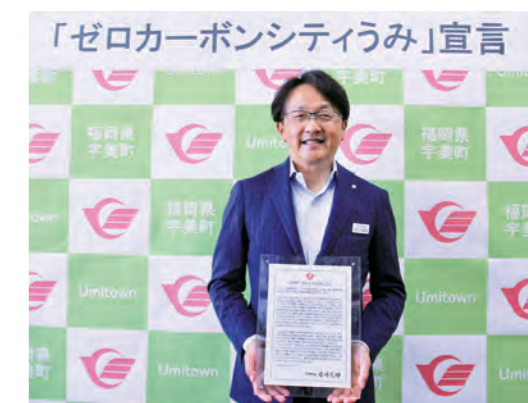
▲「ゼロカーボンシティうみ」宣言をした町長

近年、記録的な猛暑や豪雨など地球温暖化の影響と思われる異常気象が世界中で多発しています。町は世界共通のこの課題に取り組み、地域全体で脱炭素社会の実現を目指し、環境負荷の少ないまちを次世代につなぐため、2050年までに二酸化炭素排出量を実質ゼロを目指す「ゼロカーボンシティうみ」を6月3日(金)に宣言しました。今後は実現に向けて、町民、事業者などの皆さんと連携しながら取り組んでいきます。