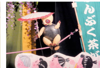
▲人形劇「ぶんぶく茶がま」