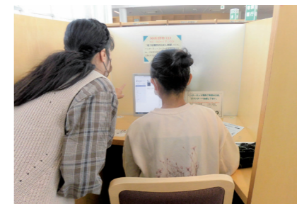
▲宇美町電子図書館おためし体験の様子

「宇美町電子図書館おためし体験」は、意外に簡単な操作だったから家でも借りてみようという方がほとんどでした。どのイベントも大盛況で、読書の秋、本に親しんだ2日間でした。