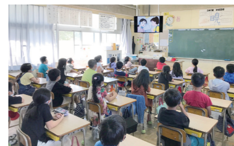
▲人権啓発アニメを鑑賞する子どもたち

新型コロナウイルス感染拡大防止のため、感謝状贈呈の様子や人権教室は放送室から各教室へ配信されました。