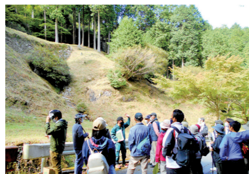
▲百間石垣の前で学芸員の話聞く参加者

10月23日(土)に「大野城跡(四王寺山)森林浴ウォーキング」(福岡県立四王寺県民の森協議会主催)が開催されました。宇美町スポーツ推進委員の方々による準備体操を行った後、出発した参加者は、学芸員による解説に耳を傾け、大野城跡の歴史ロマンに思いをはせながら、森林浴を楽しんでいました。