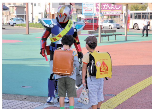
▲登校中の児童に交通事故防止を呼びかけるばってんジャー

9月27日(月)にJR宇美駅前広場で、秋の交通安全県民運動が実施されました。当日は、粕屋交通安全協会宇美支部の皆さんと町内でゴミ拾いなどボランティア活動がされている「福岡のリアルヒーロー『ばってんジャー』」さんと一緒に通勤通学している方々へ夕暮れ時や夜間の事故防止、飲酒運転撲滅など交通安全について呼びかけを行いました。