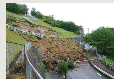
令和3年の大雨災害