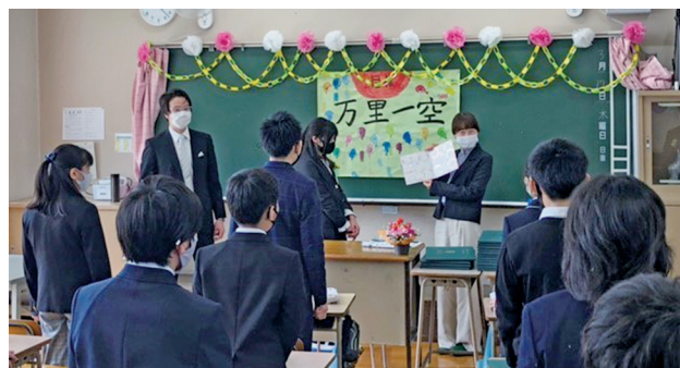
▲メッセージカードを手渡しました(宇美東小)