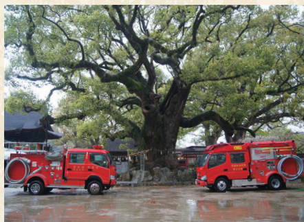
▲5分団消防ポンプ自動車の入魂式

また、3月28日(日)に宇美八幡宮で第5分団消防ポンプ自動車の入魂式が行われました。旧車両は、平成14年に入庫し19年間にわたり消防活動を支えてきました。最新鋭の消防ポンプ自動車に配備され、地域住民の安全安心を守るべく、地域防災の中心的役割を担っていきます。