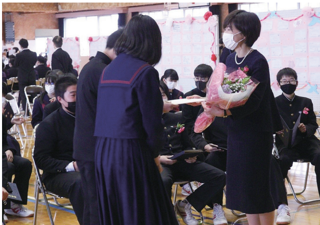
▲式後に担任と最後のホームルームが行われました(宇美東中)

宇美小学校の卒業式では、堂々と卒業証書を受け取る卒業生の姿に、6年間の成長が感じられました。