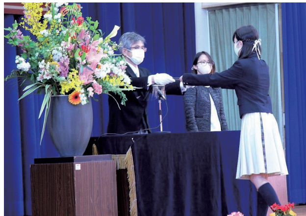
▲校長先生から卒業証書が手渡されました(宇美小)