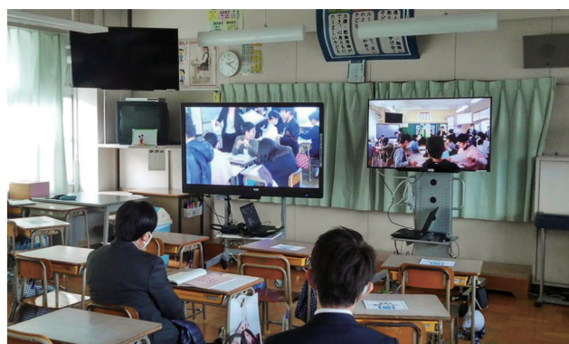
大型モニターを使った録画によるリモート参観の様子 各教室の左上には50型の4Kテレビも設置

このようにスピード感を持って取り組んできた宇美町のICT教育環境は、県下でもトップクラスになったと実感した。