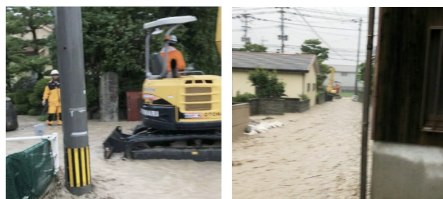
2018年7月6日の豪雨災害の様子

内容は、町民の安全の確保、早期復旧・復興のため、災害時には町災害対策本部と連携、災害対応を側面から支援し、復旧時には国・県等に要望活動を行うことなどを明記し、議員が一丸となって災害に対応できる体制を整えた。