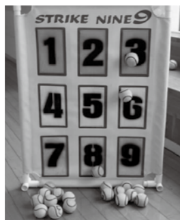
▲ストライクナイン