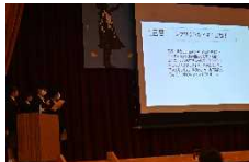
【1学年】宿泊研修の発表のようす

午後の学習成果発表2では、まず、各学年の総合的な学習の時間の取組について、活動のふり返りと学んだこと、感じたことについての発表がありました。1年生は「宿泊研修」で互いのよさを認め合うことの大切さを学んだことについて発表を行いました。2年生は「職場体験」であいさつと感謝の言葉の大切さと、働くことの大変さと素晴らしさについて発表を行いました。3年生は「上級学校体験」で訪問した高校や大学、専門学校での学びや体験、進路実現に向けて身に付けるべき力について発表を行いました。