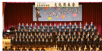
【チーム総合優勝】 赤チーム