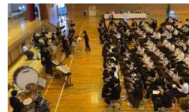
【吹奏楽部の演奏のようす】

続いて、吹奏楽部が「YOASOBI メドレー」の演奏を行いました。15名の部員がそれぞれの楽器で奏でるメロディーによって、南中生全員が手拍子でリズムを取る姿は、全校生徒が1つになった瞬間でした。また、今年の合唱コンクールは、原田小学校6年生の皆さんにも鑑賞していただきました。来年の文化発表会では、1年生としてステージの上に立って合唱する自分の姿をイメージしながら、中学生の合唱に耳を傾けていました。