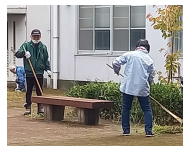
【CS環境整備部の皆さんによる除草作業のようす】