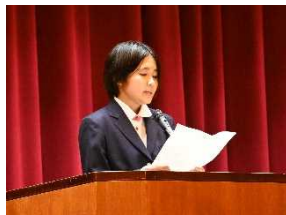
【清さんによる弁論】