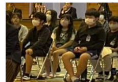
【原田小6年生のようす】

多目的室では、授業で作成した学習成果物や美術部員が描いた作品を展示しました。数多くの生徒の皆さんに見に来ていただき、じっくりと作品を鑑賞していただくことができました。作品を食い入るように見る生徒の姿から、様々な文化・芸術に対する興味や関心の高まりを感じることができました。