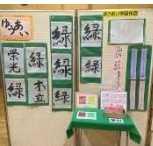
【展示】ゆうあい学級