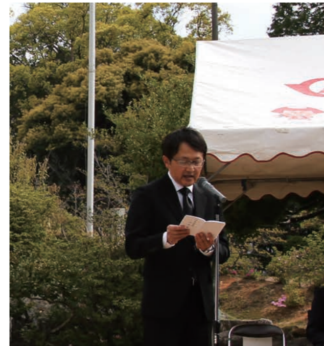
▲祭辞を述べる町長

4月11日(火)10時から、令和5年度宇美町戦没者合同慰霊祭が宇美公園慰霊塔前広場で厳かに執り行われ、町遺族会、町議会議員および福祉関係団体など44人が参列し、恒久平和を祈りました。