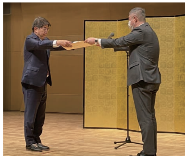
▲文部科学大臣表彰の様子