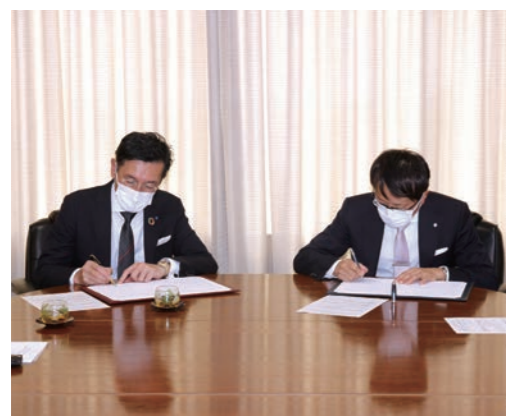
▲協定書にサインしている様子

4月13日(木)に行なった協定締結式で町長は「締結を契機に、それぞれの能力や技術、ノウハウなどを出し合い、地域課題の解決に向かって取り組んでいければ大きな意義を持つ」と話しました。