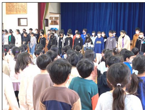
『ありがとう集会』の様子