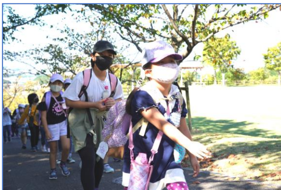
須恵運動公園へ向かう1・6年生

保護者の皆様には、お弁当や水筒の準備物のご協力をいただき、CSの皆様には、引率をしていただき、感謝申し上げます。ご協力をいただき、ありがとうございました。