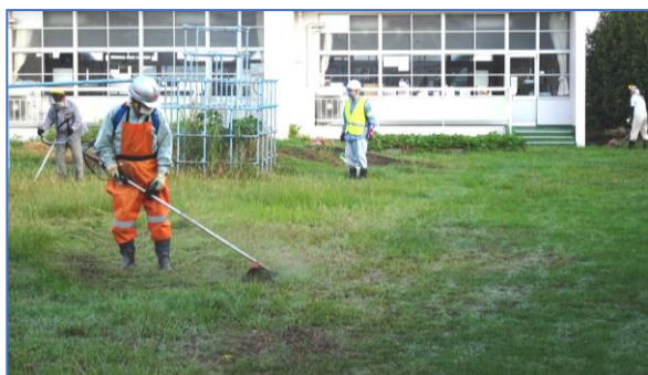
校区コミュニティ除草作業