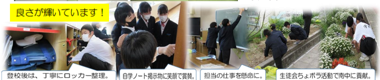
登校後は、丁寧にロッカー整理。