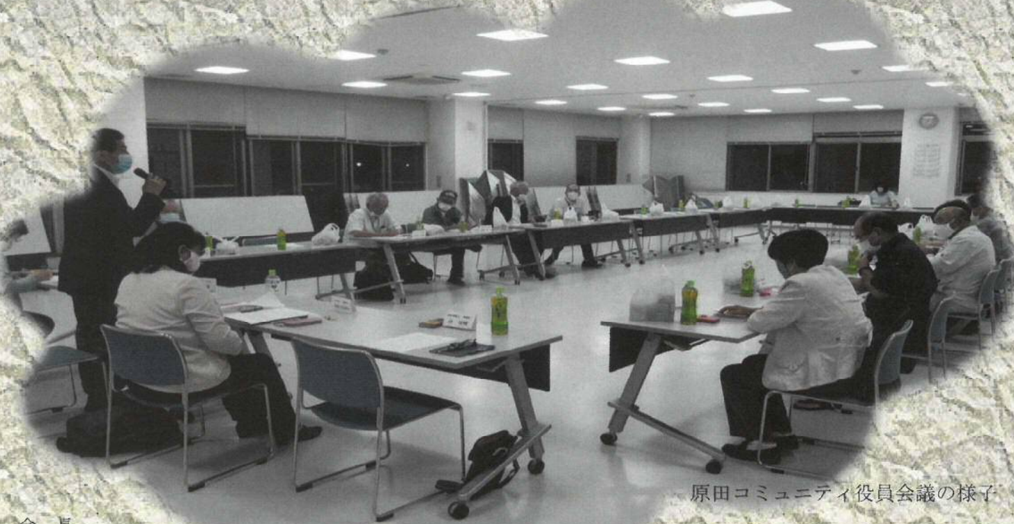
原田コミュニティ役員会議の様子