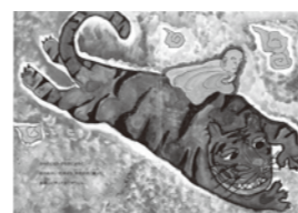
白山権現が百濟から乗ってきた虎の逸話

中世の山寺、国史跡首羅山遺跡の開山には、こんな話があります。天平年間に百濟から白山権現が虎に乗ってやってきました。乗り捨てられた虎の猛威を恐れた村人は虎の首を切り落とし、その首が光ったのです。崇りと恐れれた村人はその首を「羅(薄絹)で包んで、十一面観音を奉り、虎を供養しました。それで「首羅山」というのだそうです。最盛期には350の坊があったといわれる首羅山は現在整備の計画中です。山頂には鎌倉時代に海を渡って中国から運ばれた薩摩塔などもあります。今年10月24日(土)の一日限りの一般公開です。是非ご参加ください。