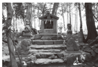
首羅山頂のようす