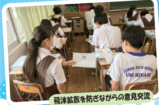
飛沫拡散を防ぎながらの意見交流