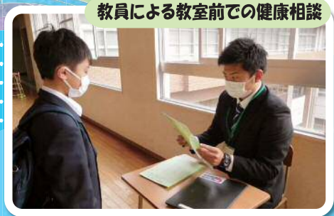
教員による教室前での健康相談