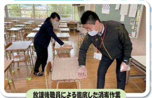
放課後職員による徹底した消毒作業