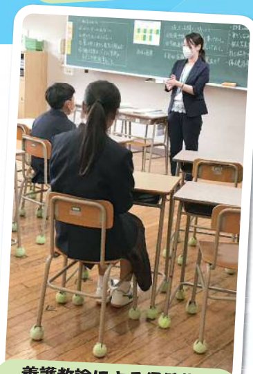
養護教諭による保健指導