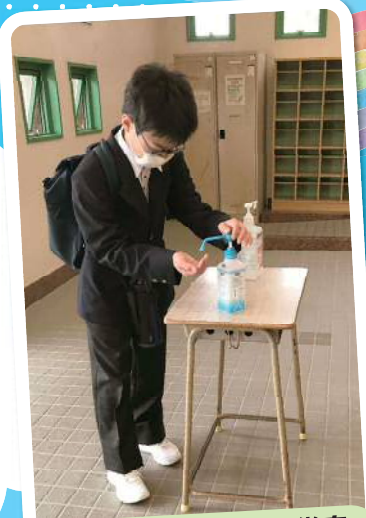
昇降口で手指消毒の徹底