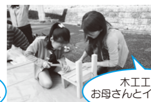
木工工作 お母さんとイスづくり