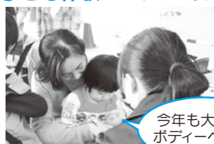
今年も大好評のポディーペイント