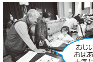
おじいちゃん、 おばあちゃんと 十字たこづくり