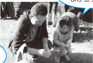
お父さんと一緒に まが玉づくり