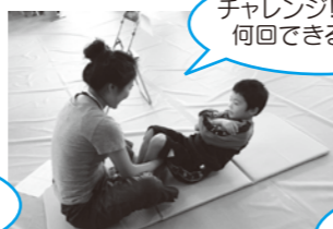
チャレンジ!体力測定 何回できるかな?