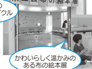
かわいらしく温かみの ある布の絵本展