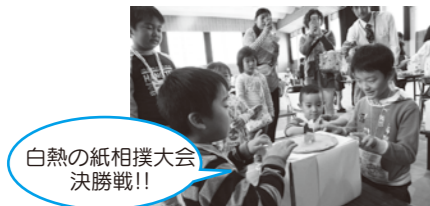
白熱の紙相撲大会 決勝戦!!