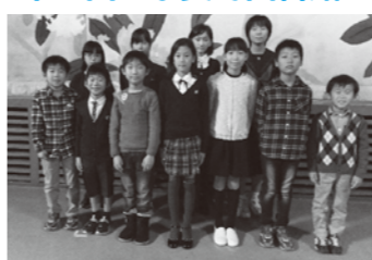
表彰を受けた上位入賞の子どもたち

「宇美町図書館を使った調べる学習コンクール」に、本年度は町内小中学生から3,120作品の応募があり、審査の結果、30作品が入賞しました。そのうち上位入賞者11人に表彰式を行い、表彰状が贈られました。