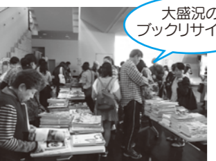
大盛況の ブクリサイクル