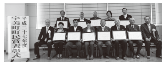
受賞されたみなさんと木原町長(1段目左)、白水議長(1段目右)

本年度は、環境、福祉、子育て等様々な分野でご活躍されている6名と5団体の表彰を行いました。