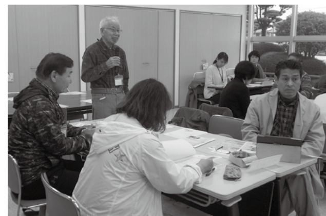
▲昨年度の交流会の様子