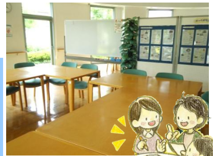
会議スペースが使えます

なお、会議スペースや備品の貸出等については、事前に登録が必要です。 【団体登録】対象…宇美町内でボランティアなどの公益的な活動をしている団体 【個人登録】対象…ボランティア活動したい方 上記のいずれについても、登録申請書を提出してください。様式は町ホームページからもダウンロードできます。詳しくは「ふみらぼ」にお尋ねください。 ※登録をしなくても、ボランティア情報の紹介やコーディネートができますので、お気軽にご相談ください。