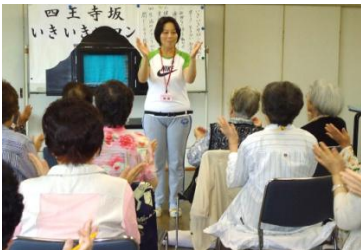
レクリエーション・手の体操 「出来なくても大丈夫ですよ」

宇美町更生保護女性会の活動のひとつ『つくしんぼ』では、子どもたちへのお話の時間を担当しています。手遊びを交えながら大型絵本やお話を披露し、子どもたちと楽しい時間を過ごしています。子どもたちは笑ったり、真剣に聞き入ったりしてお話の世界を楽しんでいました。