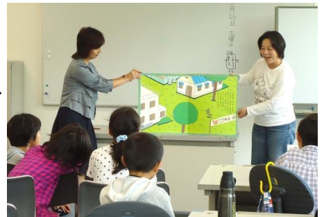
「つくしんぼ」での読み聞かせの様子

また、今年から新しく開所した『四王寺坂いきいきサロン』では、高齢者の方に紙芝居などを行っています。6月のサロンでは、最近の天体の話題や手足の体操を間にはさみながら、季節にあった七夕のお話などをしました。いきいきサロンの実行委員に参加している方もいて、一緒に活動しています。宇美ワクワクお話し会は、他のボランティア団体と協力し合っ、子どもたちの健全育成や地域の交流の場づくりのお手伝いをしています。