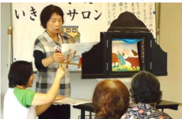
「今日が紙芝居デビューです」