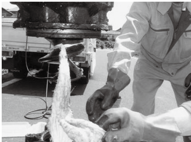
▲タオルなどがポンプに絡まり故障している様子