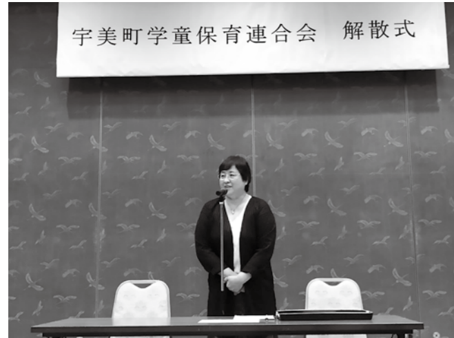
▲深見会長より感謝のことが述べられました