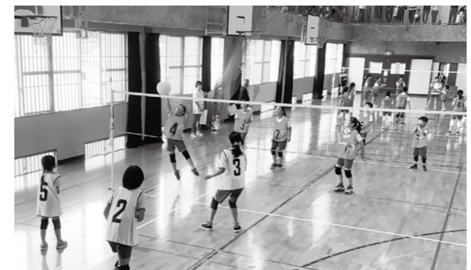
▲練習した成果を発揮し、熱戦が繰り広げられました