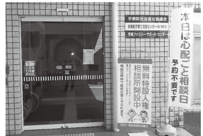
▲うみハピネスに開設された「特設人権相談所」