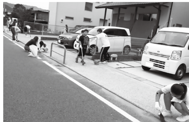
▲たくさん子どもたちが清掃活動がんばりました

また、住民の方々の中には小中学生など多くの子どもたちも積極的に参加し、地域の方々とともに清掃活動を行っていました。ご参加いただいた皆さん、ご協力ありがとうございました。