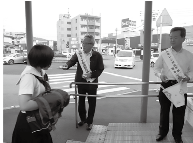
▲宇美駅前での啓発活動の様子

当町でも、「第69回社会を明るくする運動 宇美町推進委員会」が中心となり、7月1日(月)早朝より、JR宇美駅、町内各中学校の校門前で声掛け運動および啓発物を配布する啓発活動が行われました。