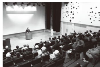
※昨年のみるみるウォーク協力員研修会の様子。