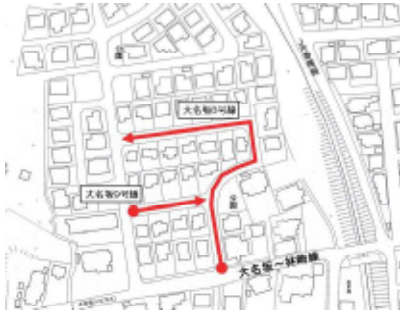
町道大名坂8号9号図

早見16号線、起点宇美中央四丁目3579番3から終点宇美中央四丁目3579番6を町道に認定。