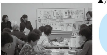
▲今年度の活動発表の様子