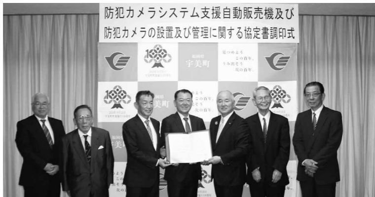
▲協定書調印式の様子