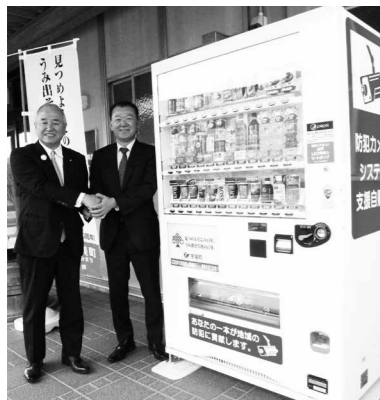
▲南別館宇美中側に設置した自販機の前で町長・理事長を撮影