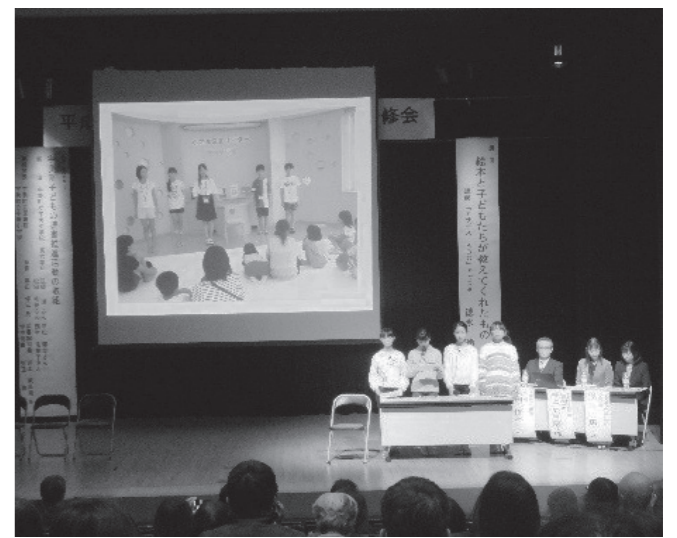
▲宇美小学校読書リーダーの発表の様子

2月2日(土)福岡市都久志会館で「福岡県子どもの読書活動交流・研修会」が開催され、宇美町と広川町が報告と実演を行いました。宇美町の発表では、小学生読書リーダー・中学生読書サポーター養成講座の取組を中心に説明。また、宇美小学校の読書リーダー4人が、以前小学校で開催した「おはなし会」を実際に演じました。