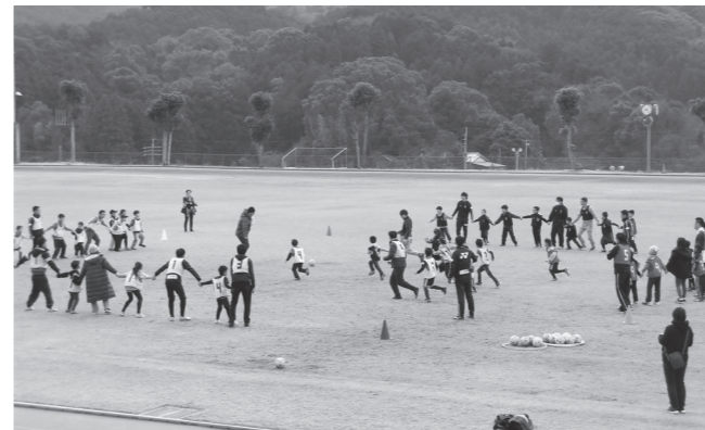
▲手をつないで自陣を守る「手つなぎナンパコーン」はチームワークが大事!

マスコットキャラの『アビーくん』と『ビビーちゃん』と一緒にボールをキックしてコーンを倒すゲームなど、4チームに分かれて点数を競い合い、参加した子どもたちから「とても楽しかった!」と満足した声が聞かれました。