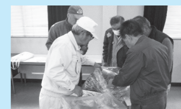
▲部会員による検品作業

薬用作物部会員により真心込めて生産されたミシマサイコの根が、いよいよ出荷されました。この根は漢方薬の原料として使われます。