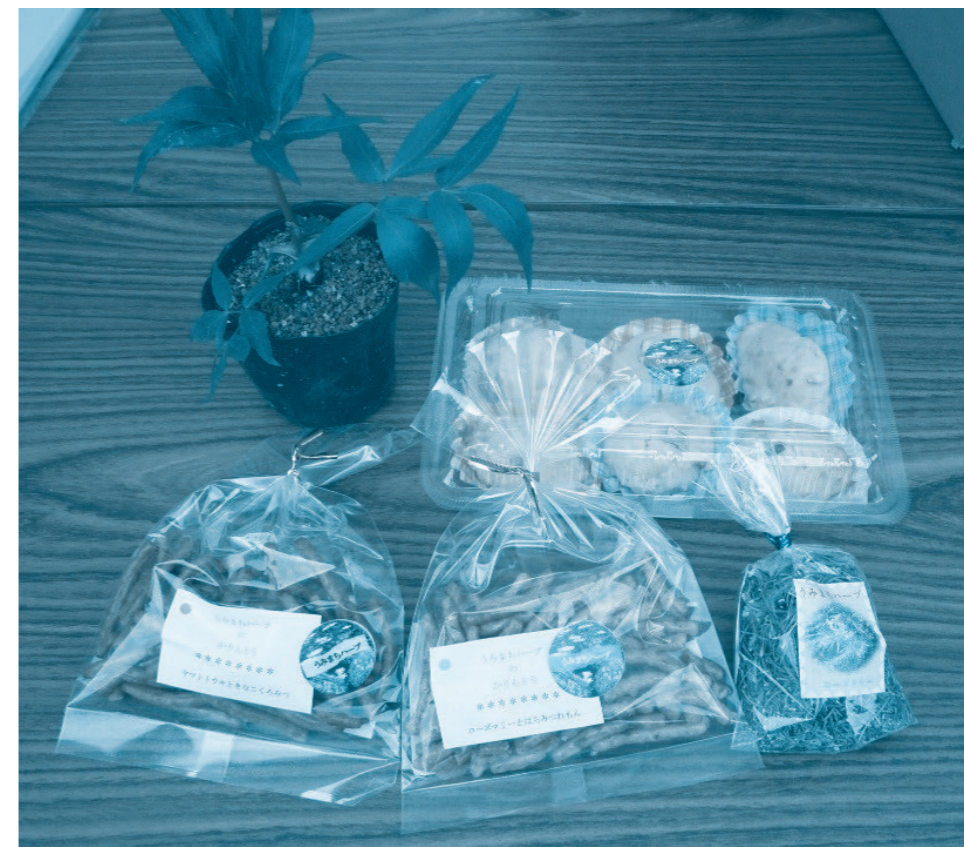
▲出展品 (上段左から) ヒュウガトウキ苗、アピオスマフィン (下段左から) きな粉黒蜜かりんとう (宇美商業高校コラボ製品)、蜂蜜レモンかりんとう、ローズマリーの乾燥葉