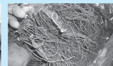
▲出荷されたミシマサイコの根