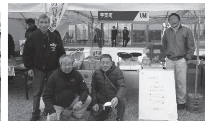
▲宇美町薬用作物生産部会の皆さん