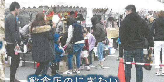
飲食店のにぎわい