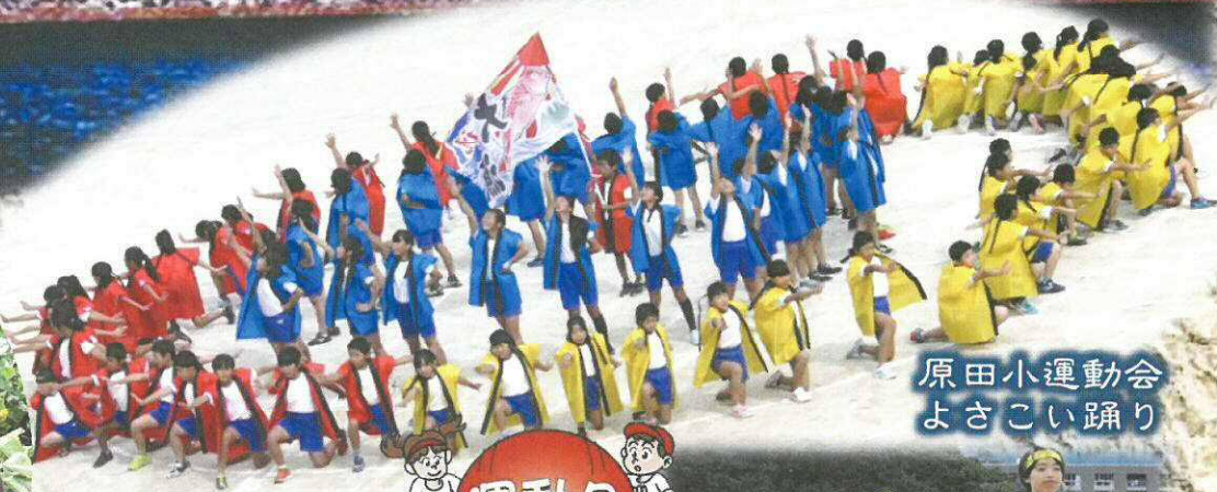
原田小運動会 よさこい踊り