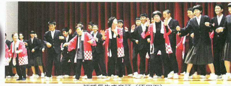
皆で長生き音頭(原田下)