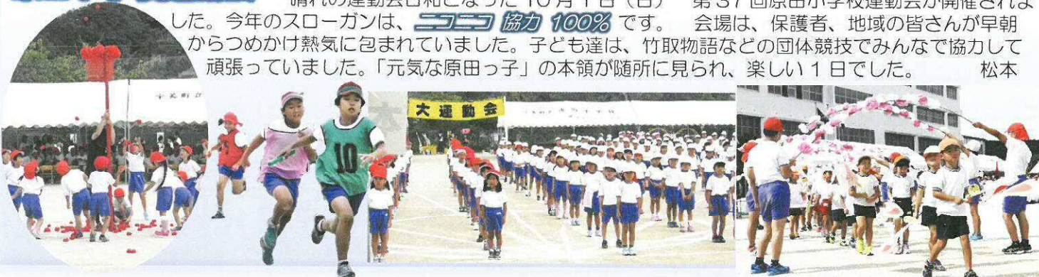
来年入学予定のチビっ子も参加

晴れの運動会日和となった10月1日(日) 第37回原田小学校運動会が開催されました。今年のスローガンは、 協力100% です。会場は、保護者、地域の皆さんが早朝からつめかけ熱気に包まれていました。子ども達は、竹取物語などの団体競技でみんなで協力して頑張っていました。「元気な原田っ子」の本領が随所に見られ、楽しい1日でした。 松本