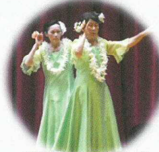
福博鎌倉のフラダンス