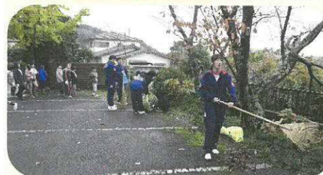
鎌倉自治会で清掃する子ども達

小中合同で学校の授業として、地域の清掃活動に取り組み、地域に貢献する子ども達の実践活動を実施しました。それぞれの自治会では地域住民と一緒に清掃活動に汗を流していました。