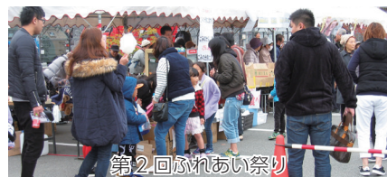
第2回ふれあい祭り 原田小学校区コミュニティ