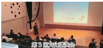
第3回文化講演会 宇美小学校区コミュニティ