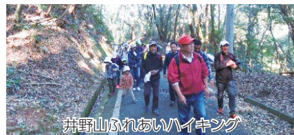
井野山ふれあいハイキング 井野小学校区コミュニティ

各小学校区コミュニティ運営協議会では、地域の特性を活かしたさまざまな事業が行われています。詳しくは、各小学校区コミュニティ運営協議会の広報誌に記載されています。(各広報誌はうみ・みらい館でもご覧いただけます)