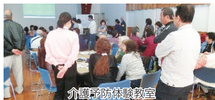
介護予防体験教室 宇美東小学校区コミュニティ