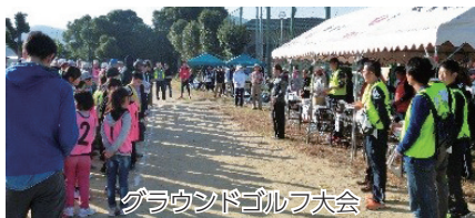
グラウンドゴルフ大会 桜原小学校区コミュニティ

各小学校区コミュニティ運営協議会では、地域の特性を活かしたさまざまな事業が行われています。詳しくは、各小学校区コミュニティ運営協議会の広報誌に記載されています。(各広報誌はうみ・みらい館でもご覧いただけます)