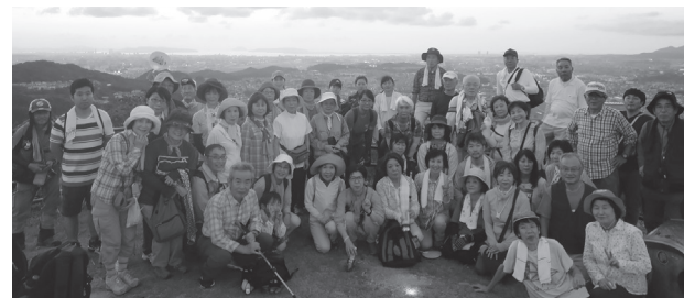
▲参加者の皆さん(福岡市方面を背景に)

今回は、夕方に役場を出発して、山頂では色鮮やかな夕焼けを、さらには全方位360度に広がる美しい夜景を楽しみました。山頂からの眺めに歓声があがり、参加者の方は街の光が描く鮮やかな夜景にしばらく目を奪われていました。