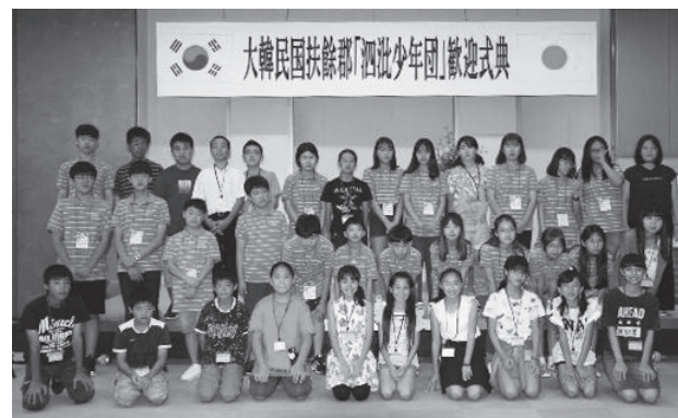
町と扶餘郡の学生で記念撮影

昨年、扶餘郡で交流をした学生は、約1年ぶりの再会となりました。大野城跡、宇美八幡宮、福岡タワー、太宰府天満宮などを見学し、両国の学生にとっては貴重な思い出になったことでしょう。これからも町と扶餘郡の架け橋として、さらに絆が深まっていくことを願っています。