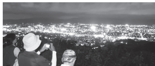
▲光り輝く夜の太パノラマは圧巻でした!(春日市方面)