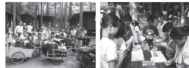
▲キャンプに参加した子どもたち ▲協力して作った特製カレー