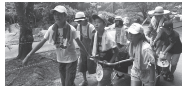
▲坂道もがんばるぞ!

地域の大人の支援を受けて、やり遂げた今回のキャンプが、子どもたちにとっての原体験となることを願っています。