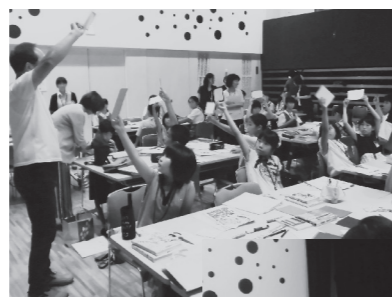
▲ポップ作成講座の様子

中学生は10月にビブリオバトル大会の開催も予定しています。皆さんも応援してください。