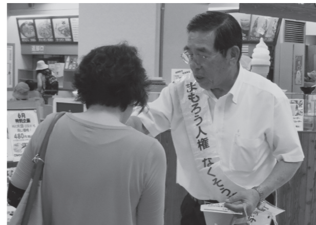
たくさんの方に声をかけ啓発を行いました

町では、7月の「同和問題啓発強調月間」、「社会を明るくする運動強調月間」、「青少年の非行・被害防止全国強調月間」の3つの強調月間を「宇美町人権問題啓発強調月間」と定めています。6月30日(金)には、JR宇美駅周辺、町内スーパー2か所で宇美町人権教育推進協議会による街頭啓発が行われ、人権を尊重する地域社会づくりについて呼びかけました。