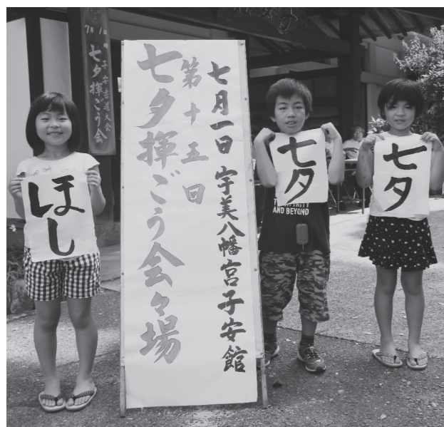
みんな上手に書きました!!

今年度も、町内から158名の小学生が参加し、どの子どもたちも真剣な表情で筆を走らせていました。