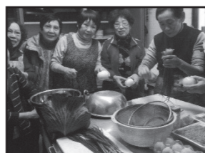
(井野小校区) ひばりが丘1 ほのぼの会との交流会

現在、宇美町では41名の民生委員・児童委員と2名の主任児童委員、総勢43名が活動しています。民生委員・児童委員は地域の福祉を担うボランティアで、役場などの専門機関へ「つなぐ」パイプ役です。また、主任児童委員は子育てや子どもに関することを支援する委員です。各地域の民生委員・児童委員は皆さんの身近な相談相手として活動をおこなっています。