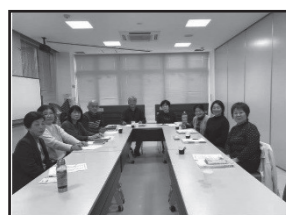
(原田小校区) 原田小校区部会の様子