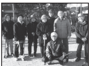
(宇美小校区) 辻荒木樟寿会との交流会