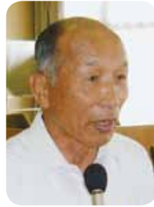
犬塚 齊 議員

犬塚 国の政権交代により政治、行政の内容が国民にわかりやすくなり、国民により行政に対して意見が言えるようになった。地方自治体も地方分権の時代を先取りして、現在進められている消防広域化な