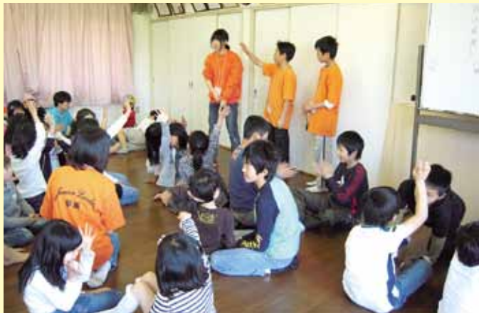
▲地域の子ども会 ジュニアリーダー活動