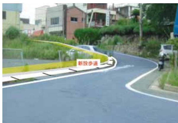
▲町道桜原～柳原線歩道設置のイメージ

●宗像・粕屋地域消防広域化協議会負担金 178万円 ●学校運営協議会推進事業費 223万円 ●橋梁長寿命化修繕計画策定業務委託費 300万円減額 ●サヤ橋架替工事負担金 1,409万円減額 ●消耗品等需用費 510万円減額