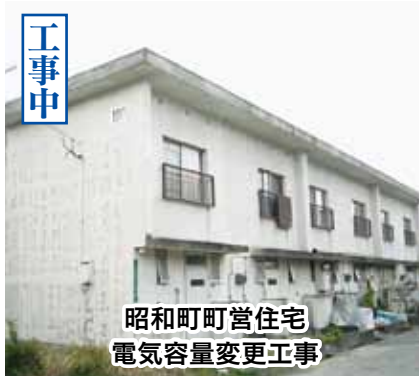
昭和町町営住宅 電気容量変更工事