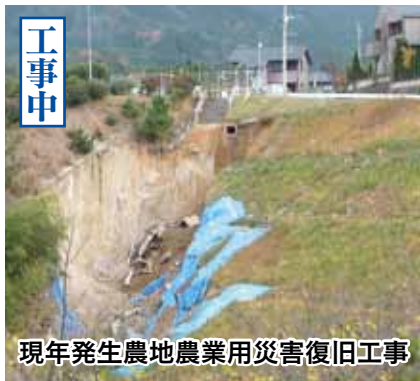
現年発生農地農業用災害復旧工事