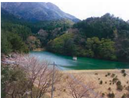
草ヶ谷ダム（平成21年3月撮影）