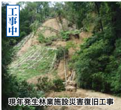
現年発生林業施設災害復旧工事