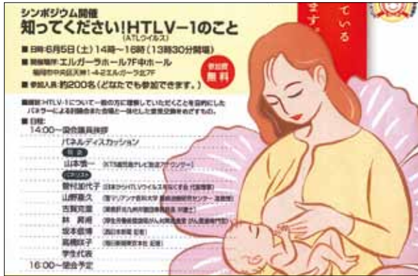
▲知ってください！HTLV-1のこと