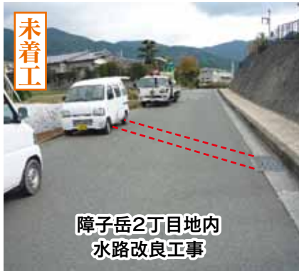
障子岳2丁目地内 水路改良工事