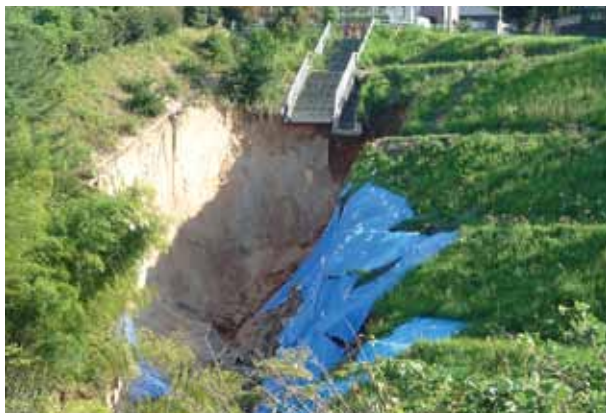
▲神武原地区水路災害復旧工事