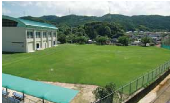
▲宇美南町民センター多目的芝生広場

宇美町子ども読書活動推進計画及び町立図書館利用状況。 宇美町緑のグラウンド開放事業実施要綱。