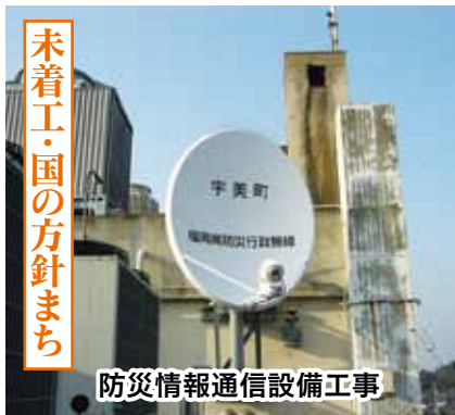
防災情報通信設備工事