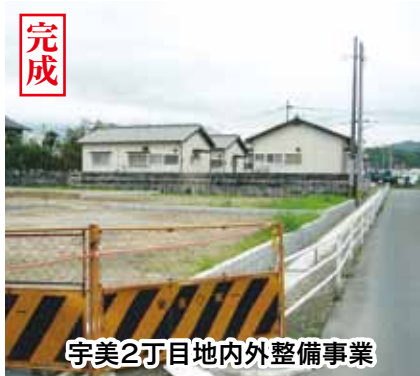
宇美2丁目地内外整備事業