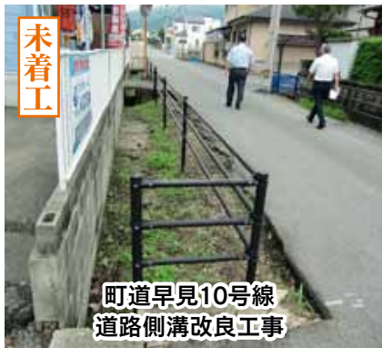
町道早見10号線 道路側溝改良工事