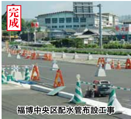
福博中央区配水管布設工事