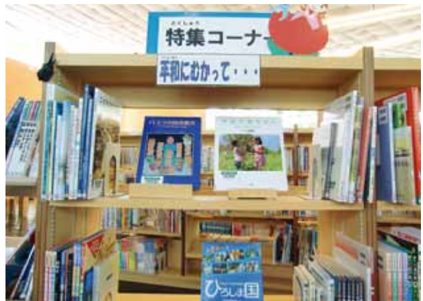
▲平和教育特集コーナー

は考えていない。 鳴海 町独自の平和の取組についてはどうか。 町長 町の取組として、7月から8月にかけての夏休みを中心に、図書館で平和について考えるコーナーを設ける予定。改めて平和の大切さを町民一人一人に考えてほしいという趣旨をもって、今年度実施したい。