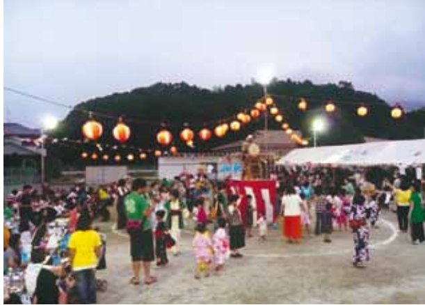
▲行政区の夏まつり