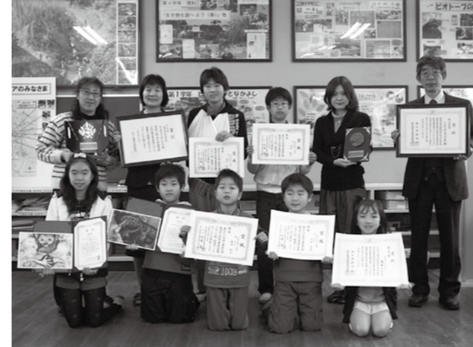
学校賞を受賞した宇美小学校のみなさん

宇美町は、「子ども読書の街」として読書活動に力を入れています。宇美小学校でも、毎日10分間読書を行い、読書量が年々増えているそうです。また、読んだ本は「ブックリー」に記録し、読書感想文や読書感想画に表すことで、読書の質を深めています。