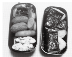
自慢の手づくり弁当が出来ました！