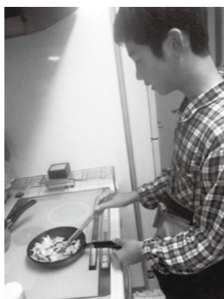
弁当づくりに奮闘中

「お弁当の日」を通して、宇美東小学校の子ども達は、「食」に対する関心を高めるとともに、家族との触れ合いを深めることができます。もちろん、職員も自分で弁当を作って子ども達と一緒に食べています。