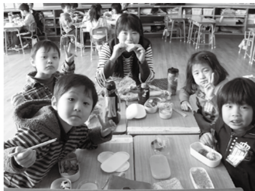
「お弁当の日」は笑顔がいっぱい

今年度は、11月、1月、2月、3月に各1回ずつ、合計4回実施しています。3年目ということもあり、子ども達に事前に「チャレンジカード」を配って、弁当作りに対する関心と意欲を高めました。①自分だけで作る「パーフェクトコース」、②親と一緒に作る「お手伝いコース」、③おにぎりだけ自分で作る「おにぎりコース」、④作ってくれる人と同じ時間に起きる「早起きコース」、⑤作ってくれた人に、思いっきり感謝を伝える「ありがとうコース」の中から、子ども達は自分のコースを選びます。